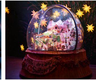
سحر جبال الألب