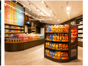
متجر شوكولاتة ليندت