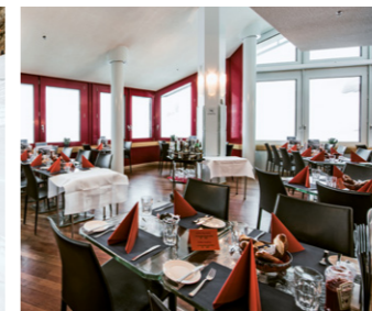
وجبات حلال متوفرة