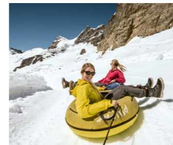
ملاهي الثلج سنو فان