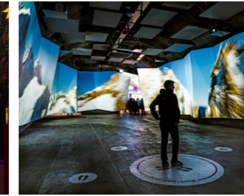
تجربة سينمائية 360 درجة