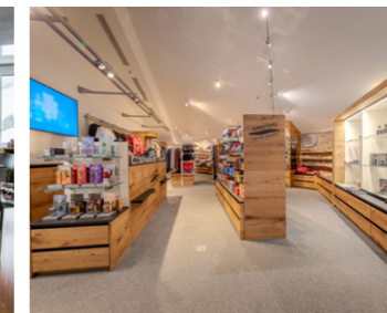
متجر قمة أوروبا